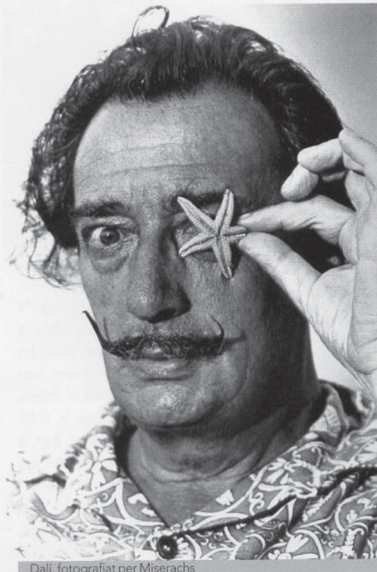
Dalí, fotografiat per Miserachs

Dalí ja havia travessat l'Atlàntic als anys trenta, en vaixells que tardaven un mes a arribar a l'altra banda de l'oceà, quan cercava la fama. Ara és la seva fama, consolidada post mortem , la que va fàcilment d'Europa a Amèrica del Nord, i viceversa, en qüestió d'hores.*