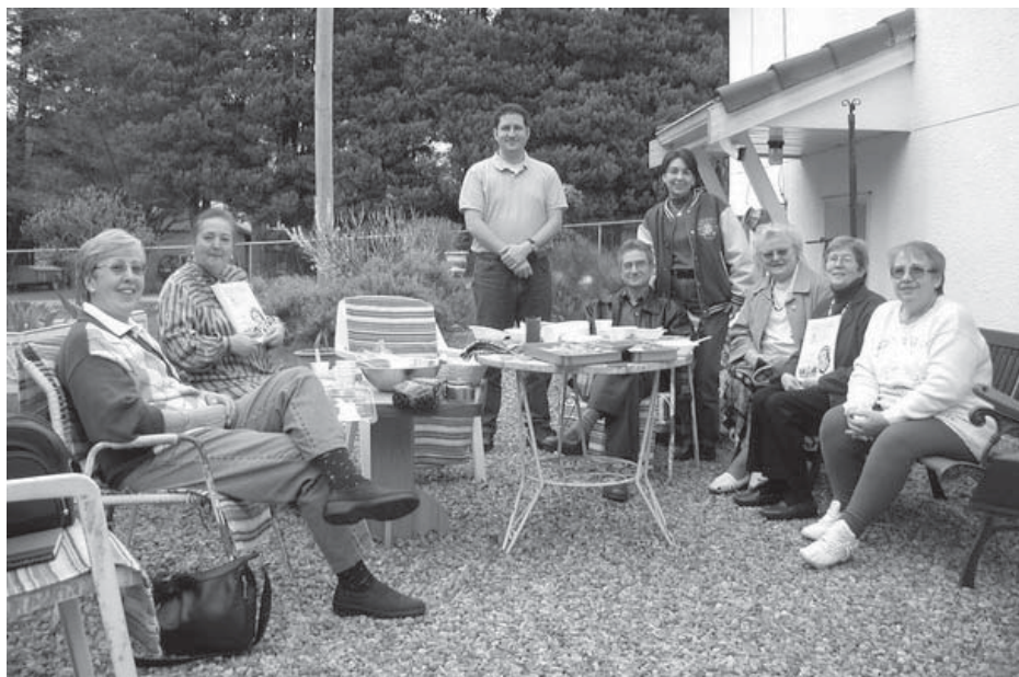
Després de la feineda, el nostre grup reposa davant la càmera, satisfet per la feina ben feta.