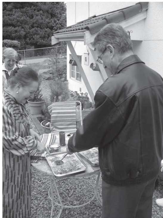
Un dels nostres esforçats participants en el Taller afanyant-se a fer una feina ben feta sota l'atenta supervisió de la instructora.