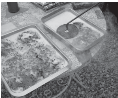
Una de les parts més delicades en el procés de creació de la Crema Catalana.