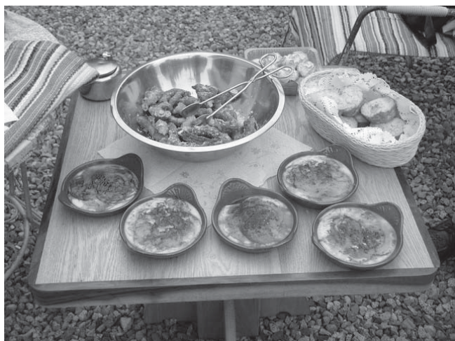
I aquí teniu el resultat de tots els esforços i afanys. Algú/na dubta que això és art???