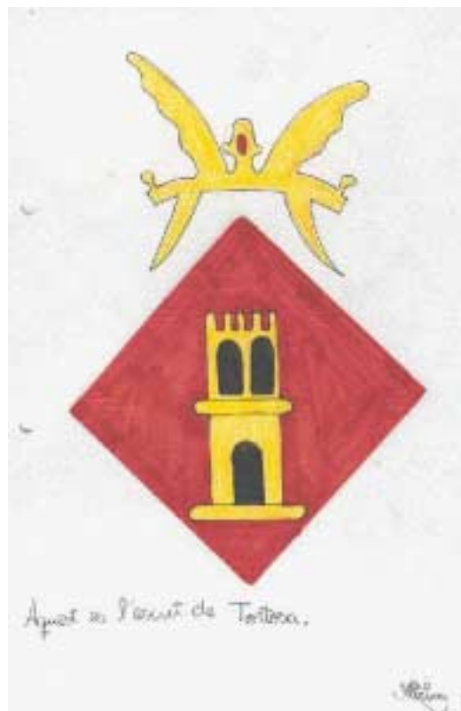
ESCUT DE TORTOSA

serveis. La documentació formarà una nova secció de l'arxiu, dedicada a la figura Alberni.