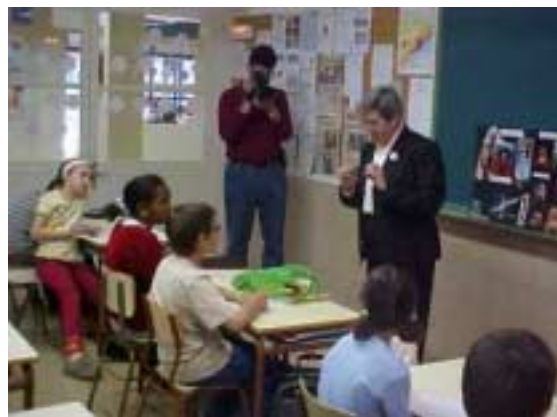
L' Angelina respon a una pregunta feta pels alumnes sota l' atenta mirada del càmera de Barcelona Televisió.

-No va poder veure els treballs, ja li enviaré.