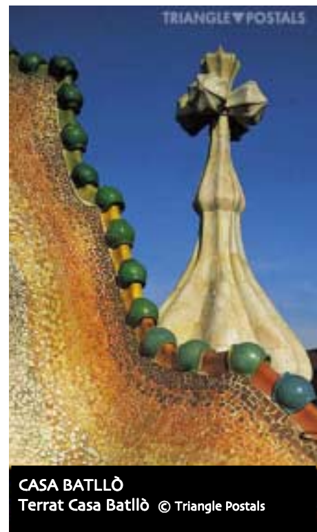
CASA BATLLÒ Terrat Casa Batllò

Després de morir, el 1926, ell i la seva obra van entrar en un període d'ostracisme, fins que els corrents avantgardistes i el moviment internacional el van recuperar, presentant-lo com un exemple de modernització i renovació de l'arquitectura del segle XX.