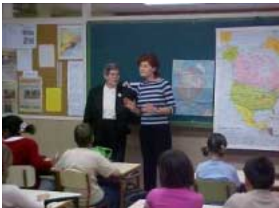
L'Angelina i la Rosa, tutora de la classe, van explicar on era situat geogràficament el Canadà i ..... evidentment Vancouver.