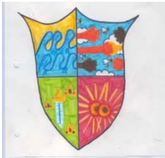
L' ESCUT ALBERNÍ I TEIXIDOR