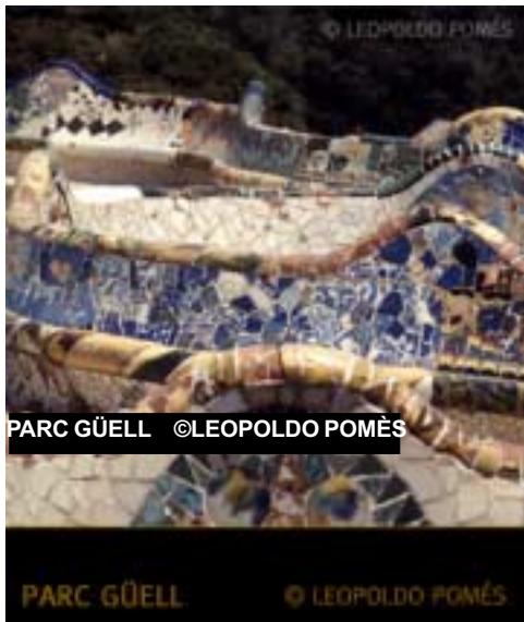
PARC GÜELL

Essent molt jove li van arribar les primeres comandes procedents del món eclesiàstic i de la burgesia, que sempre serien els seus principals clients. Entre aquests cal destacar l'Associació de Devots de Sant Josep,