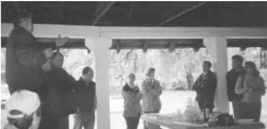
Els membres de la Junta