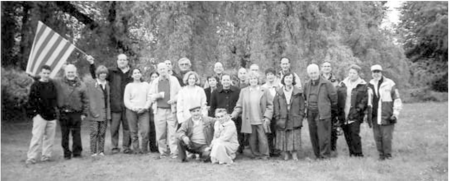
La fotografia de tot el grup