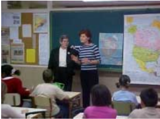
L'Angelina i la Rosa, tutora de la classe, van explicar on era situat geogràficament el Canadà i ..... evidentment Vancouver.