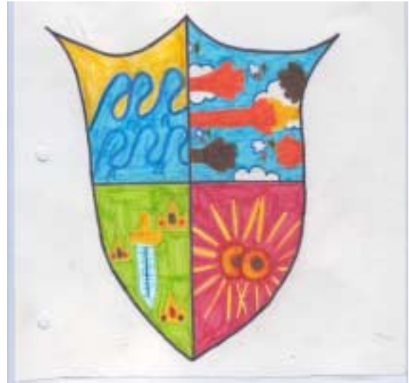
L' ESCUT ALBERNÍ I TEIXIDOR