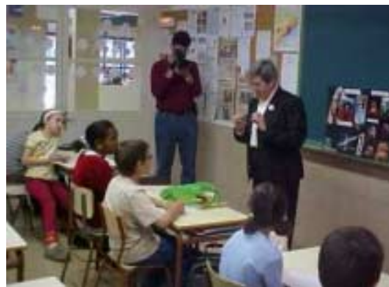
L' Angelina respon a una pregunta feta pels alumnes sota l' atenta mirada del càmera de Barcelona Televisió.

-No va poder veure els treballs, ja li enviaré.