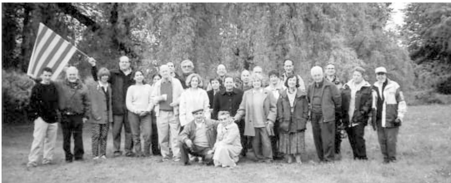
La fotografia de tot el grup